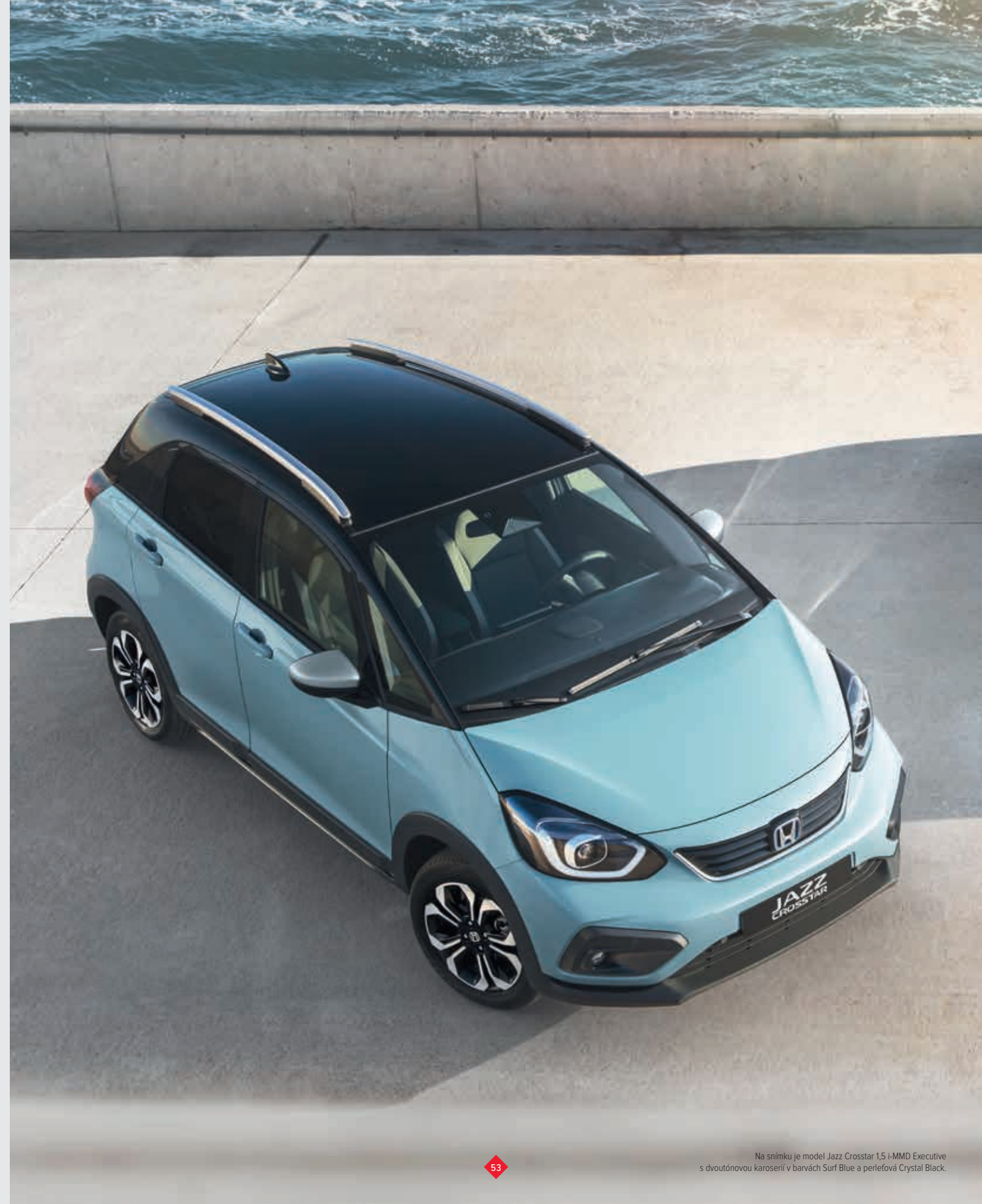
Na snímku je model Jazz Crosstar 1,5 i-MMD Executive s dvoutónovou karoserií v barvách Surf Blue a perletová Crystal Black.

◆ standardní výbava - není v nabídce ◇ volitelně