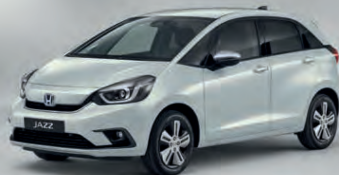
PRÉMIOVÁ PERLEŤOVÁ SUNLIGHT WHITE