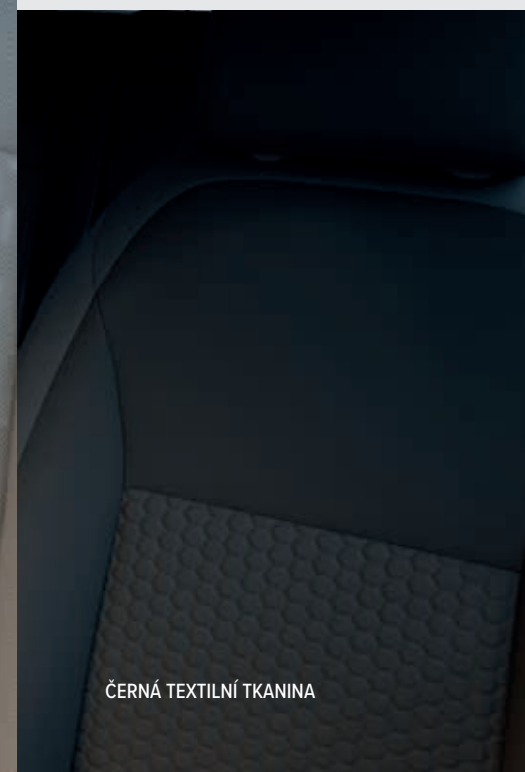
ČERNÁ TEXTILNÍ TKANINA