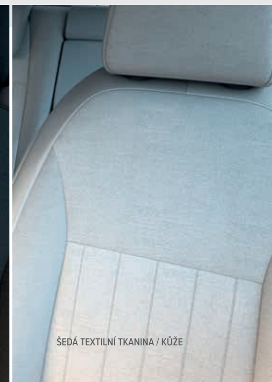
ŠEDÁ TEXTILNÍ TKANINA / KŮŽE