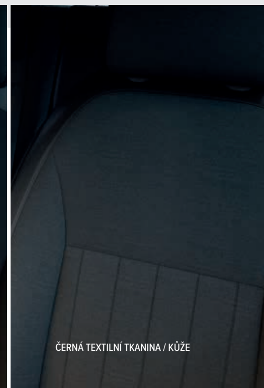
ČERNÁ TEXTILNÍ TKANINA / KŮŽE