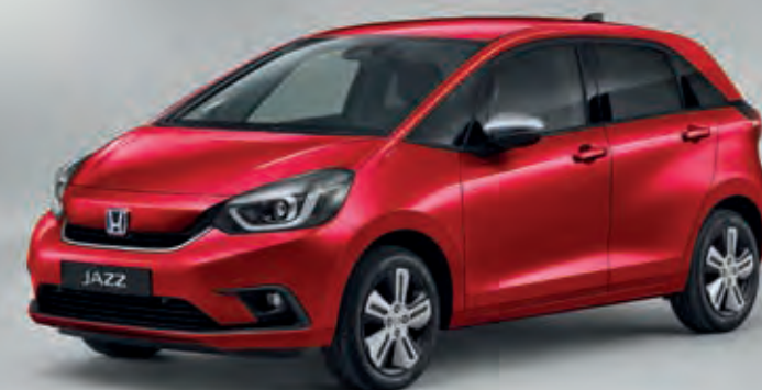
PRÉMIOVÁ METALICKÁ CRYSTAL RED