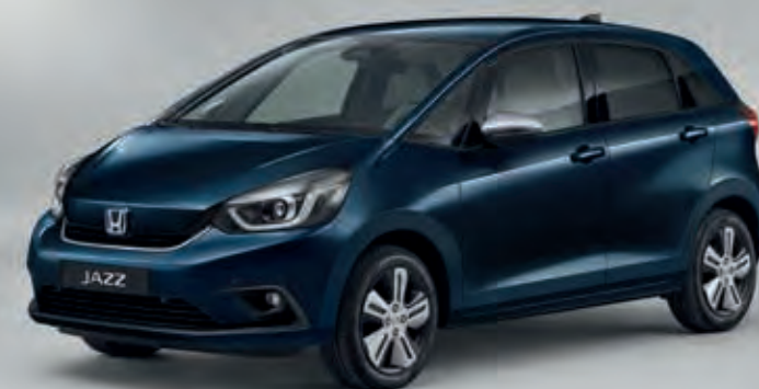
METALICKÁ MIDNIGHT BLUE BEAM