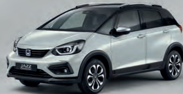
PRÉMIOVÁ PERLEŤOVÁ SUNLIGHT WHITE / DVOUTÓNOVÁ VARIANTA