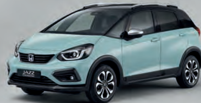
SURF BLUE / DVOUTÓNOVÁ VARIANTA