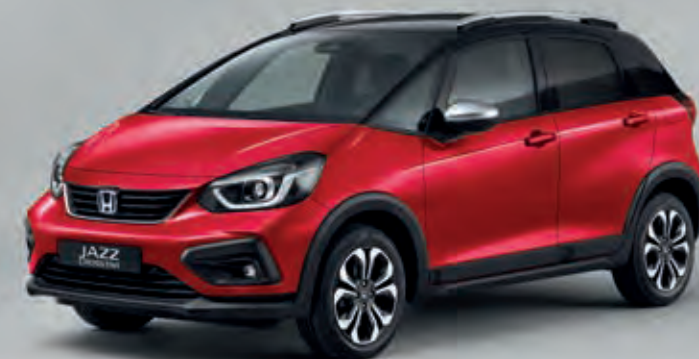
PRÉMIOVÁ METALICKÁ CRYSTAL RED / DVOUTÓNOVÁ VARIANTA