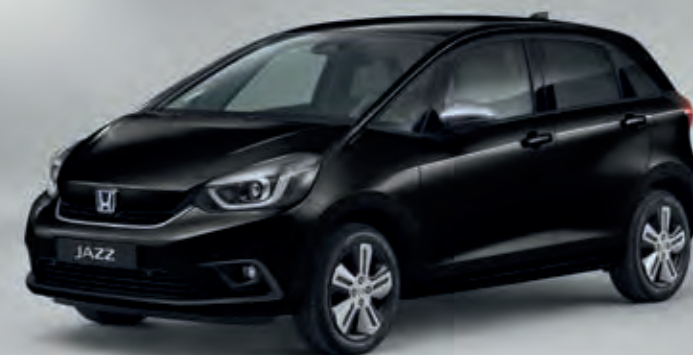
PERLEŤOVÁ CRYSTAL BLACK