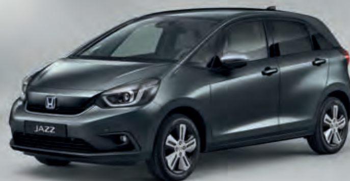
METALICKÁ SHINING GRAY