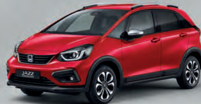
PRÉMIOVÁ METALICKÁ CRYSTAL RED